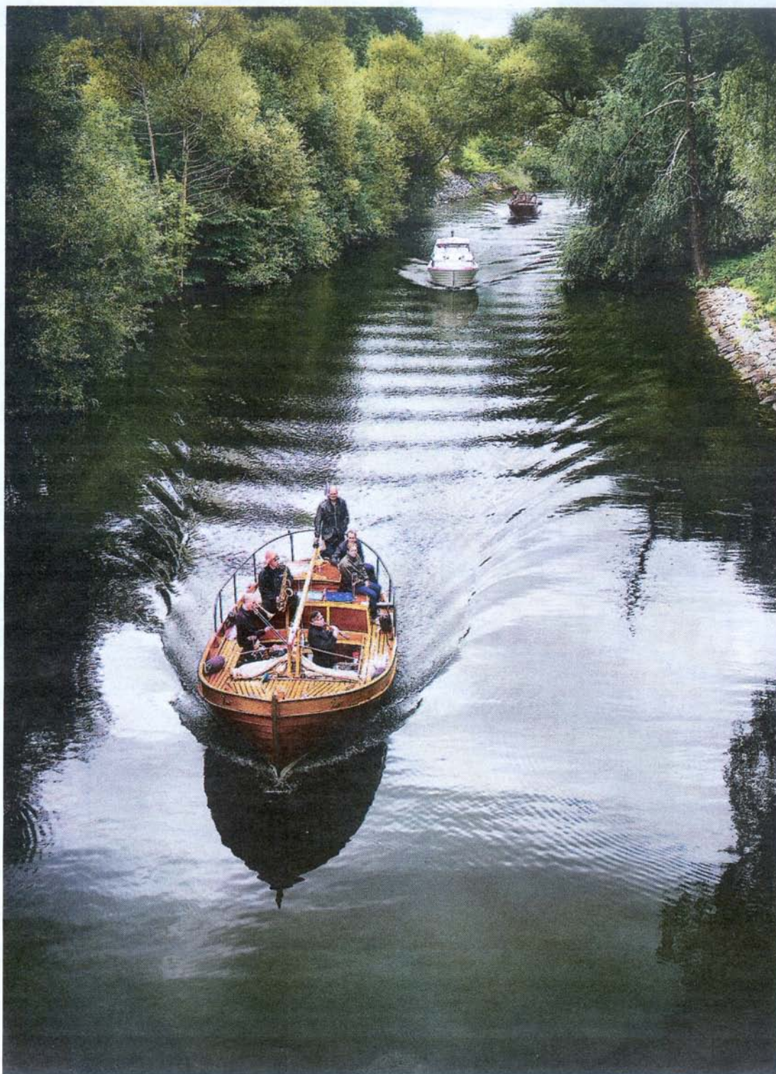
Processionen av motorbåtar på Stockholms Mälarpvatten leddes av en orkesterbåt.