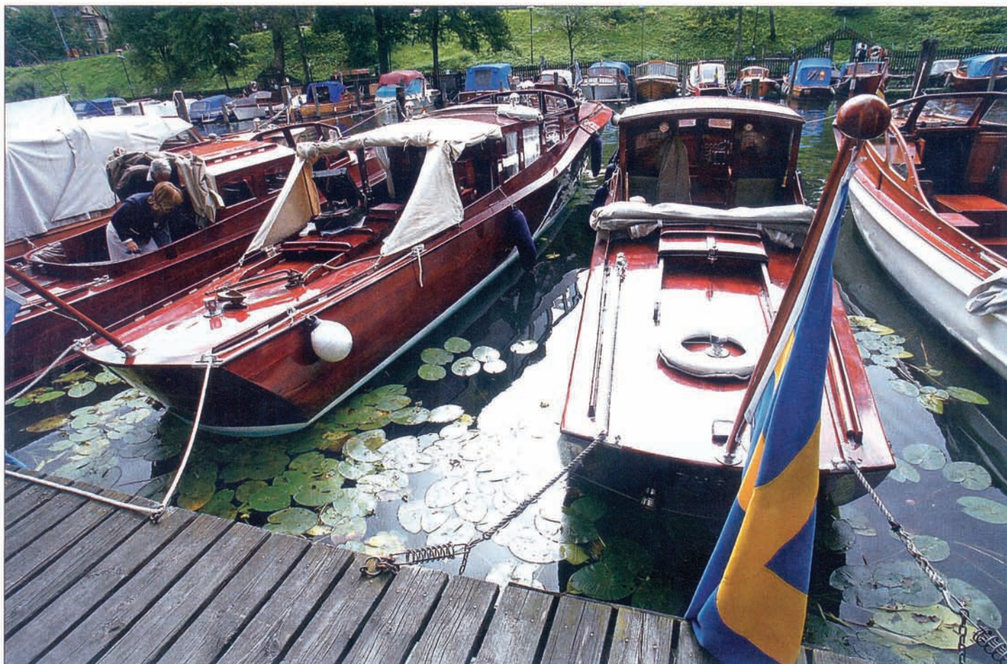
Välputsade veteranbåtar på Heleneborgs båtklubb.