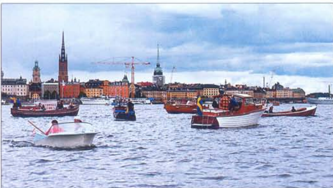
Efter avslutad parad samlades alla båtar på Riddarfjärden och tutade.