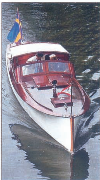
Veteranbåt som deltog i "mannekänguppvissningen".