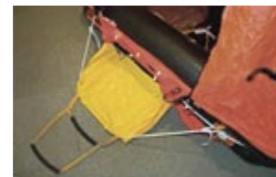
Stege för att underlätta bordning av flotten.