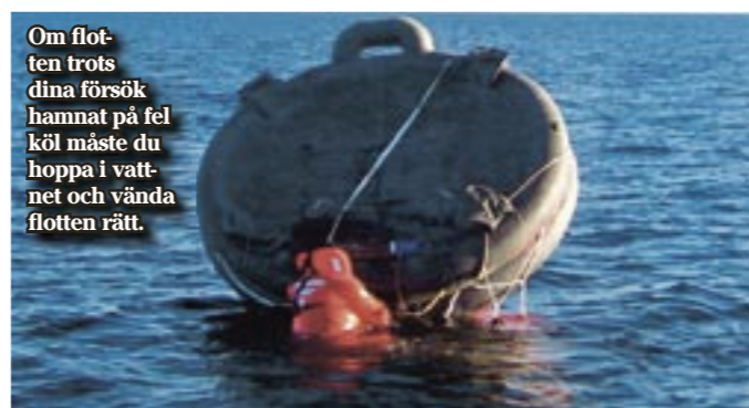
Om flotten trots dina försök hamnat på fel köl måste du hoppa i vattnet och vända flotten rätt.