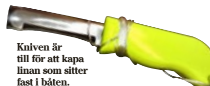
Kniven är till för att kapa linan som sitter fast i båten.