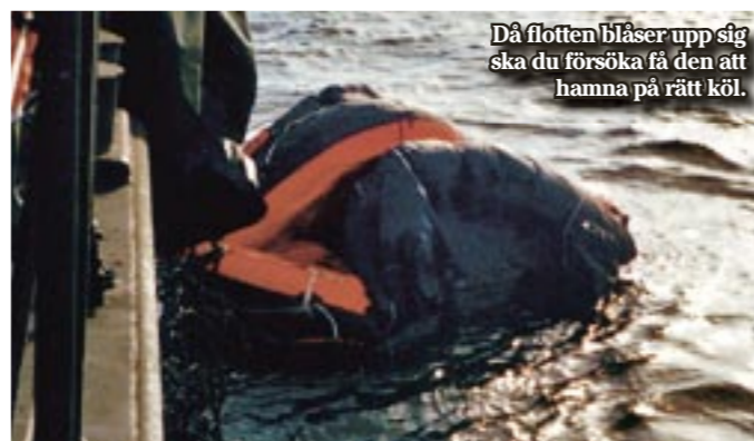
Då flotten blåser upp sig ska du försöka få den att hamna på rätt köl.