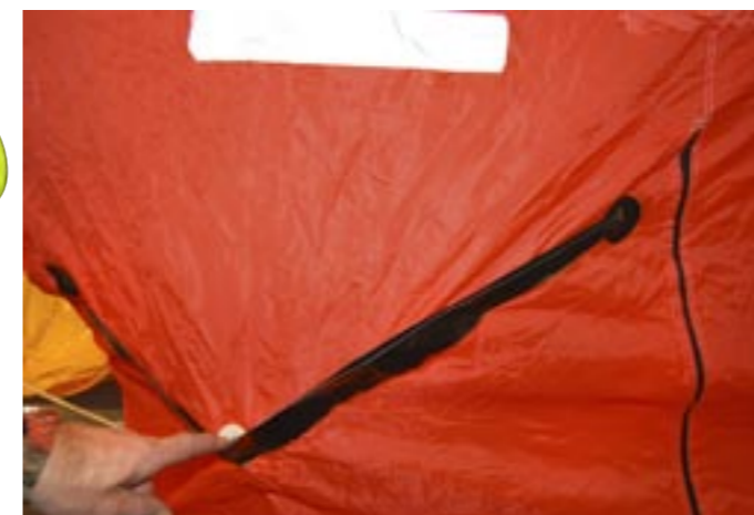
Om det regnar kan man samla regnvatten genom denna finurliga anordning. Vattnet rinner då in i plastpåsen på insidan.