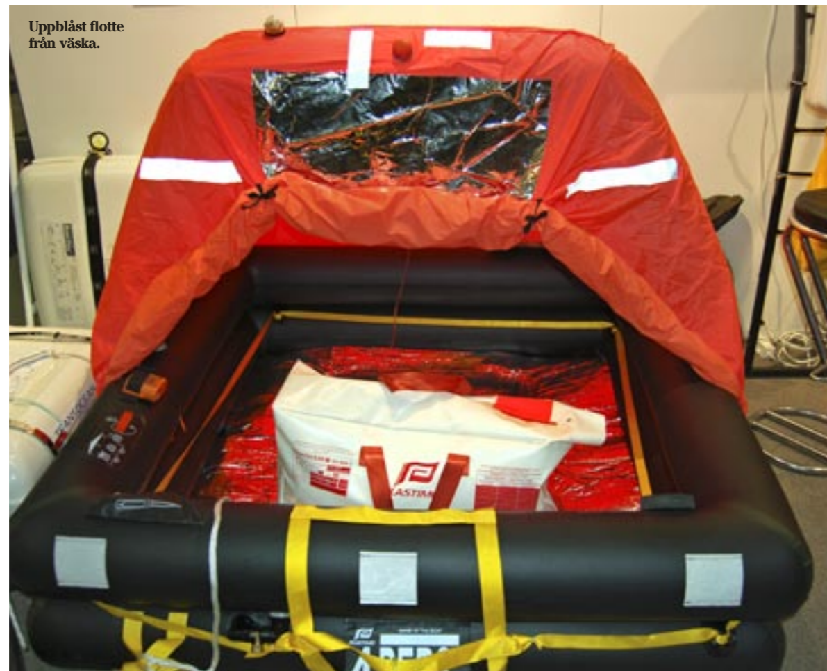
Uppblåst flotte från väska.

Stäng för öppningen. Då behåller man värmen bättre och undviker att vatten stänker in. Sedan kan man inte göra så mycket mer än underhåll och vänta. Nu gäller det att hålla värmen. Kölden är nu den svåraste fienden.