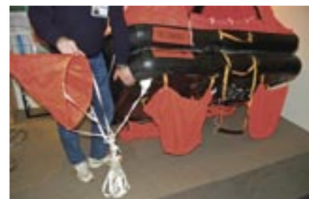
Under flotten finns ballastsäckar som fylls med vatten. Dess funktion gör att flotten gungar mindre. Till vänster syns ett drivankare. Se till att få ut det så driver flotten långsammare.