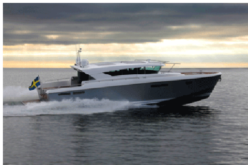
Svenska Delta 54 hade världspremiär på mässan

Intresset för båtlivet ökar igen. Det kan både utställarna och arrangören av den 14:e Scandinavian Boat Show skriva under på.